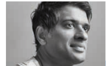
Dr. Rangan Chatterjee