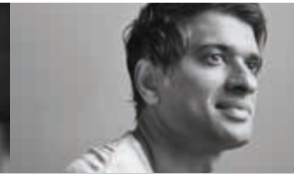
Dr. Rangan Chatterjee